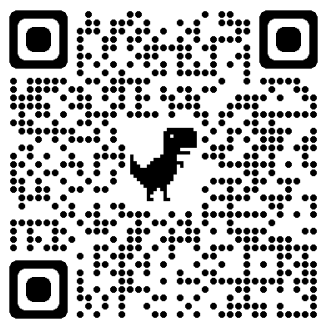
Tableau d'affichage virtuel